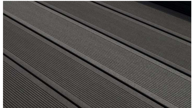
Rozdílný směr pokládky

Časem se tento efekt vytrácí. Doba, za jakou se ztratí zcela, je dána typem povrchu/broušením a především intenzitou užívání terasy, klimatickými podmínkami a způsobem údržby.